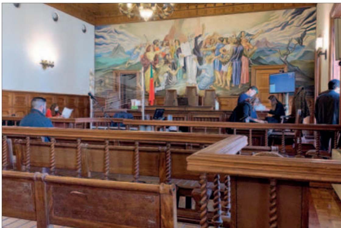
NO TRIBUNAL DE VIANA DO CASTELO FOI COLOCADA UMA BARREIRA DE PLÁSTICO PARA PROTEGER OS JUÍZES. ESTÁ IMEDIATAMENTE À FRENTE DO MICROFONE, ONDE ARGUIDOS E TESTEMUNHAS VÃO DEPOR.